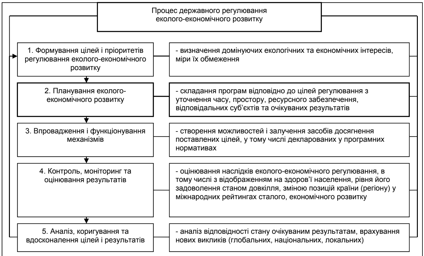
Рисунок 1. Процес державного регулювання еколого-економічного розвитку та місце в ньому планування

цілей, завдань, відповідальних суб'єктів, очікуваних результатів і затребуваних ресурсів щодо узгодження екологічних та економічних інтересів і забезпечення на цій основі прогресивних змін (рис. 1).