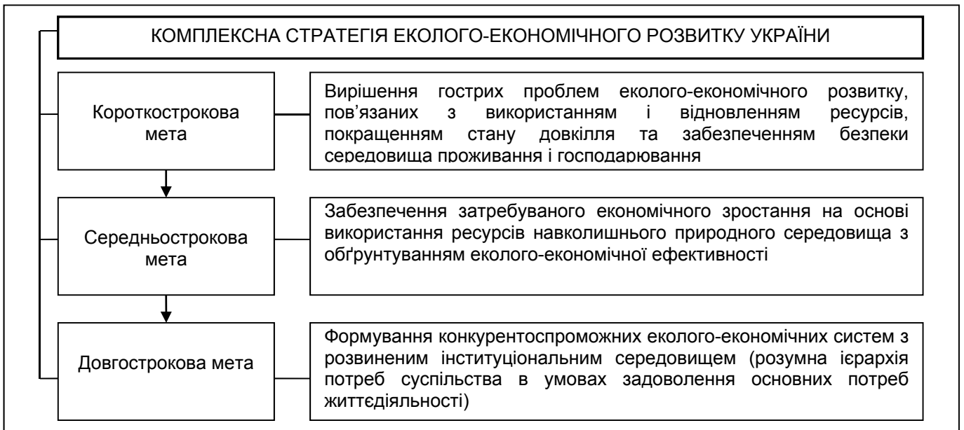
Рисунок 5. Мета стратегій еколого-економічного розвитку України в розрізі різнострокової перспективи досягнення

- Первинні цілі стратегії еколого-економічного розвитку України: 1. Демоніполізація ринку природних ресурсів; 2. Промоція застосування інструментарію екологічного маркетингу з метою формування екологічно орієнтованого попиту та задоволення відповідних потреб; 3. Цільовий еколого-економічний розвиток в обмежених просторових масштабах;