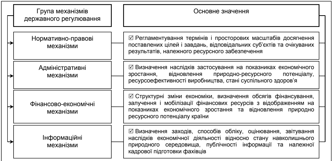
Рисунок 4. Стратегічне планування в системі механізмів державного регулювання еколого-економічного розвитку з позиції значимості

перенесення центру ваги і відповідальності за розв'язання ресурсо-екологічних проблем на місцеві органи влади та управління [9, с. 38; 10]. Погоджуємось, що зростає функціональність у забезпеченні еколого-економічного розвитку місцевих органів державної влади, хоча в поточних вітчизняних умовах цей процес є дещо ускладненим. Також цінним є висновок щодо закладення пріоритетів еколого-економічного розвитку в прогнозування соціально-економічних процесів. Оскільки саме поняття «соціально-економічний розвиток» є доволі суперечливим, адже, як і «еколого-економічний», ставить у єдність протилежні процеси, вважаємо, що не таким однозначним є вищість соціально-економічних цілей. У табл. 1 відобразимо авторське бачення щодо місця стратегічного планування в сфері державного регулювання еколого-економічного розвитку в системі стратегічного планування розвитку країни взагалі. Зокрема дана ієрархія є прийнятною для України.