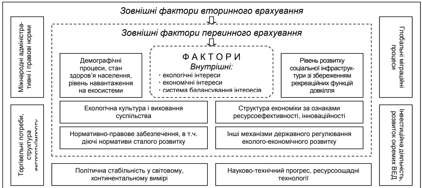
Рисунок 2. Основні факторні групи стратегічного планування у сфері державного регулювання еколого-економічного розвитку країни